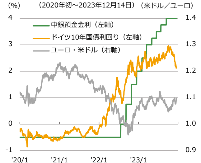
※中銀預金金利は発表日ベース